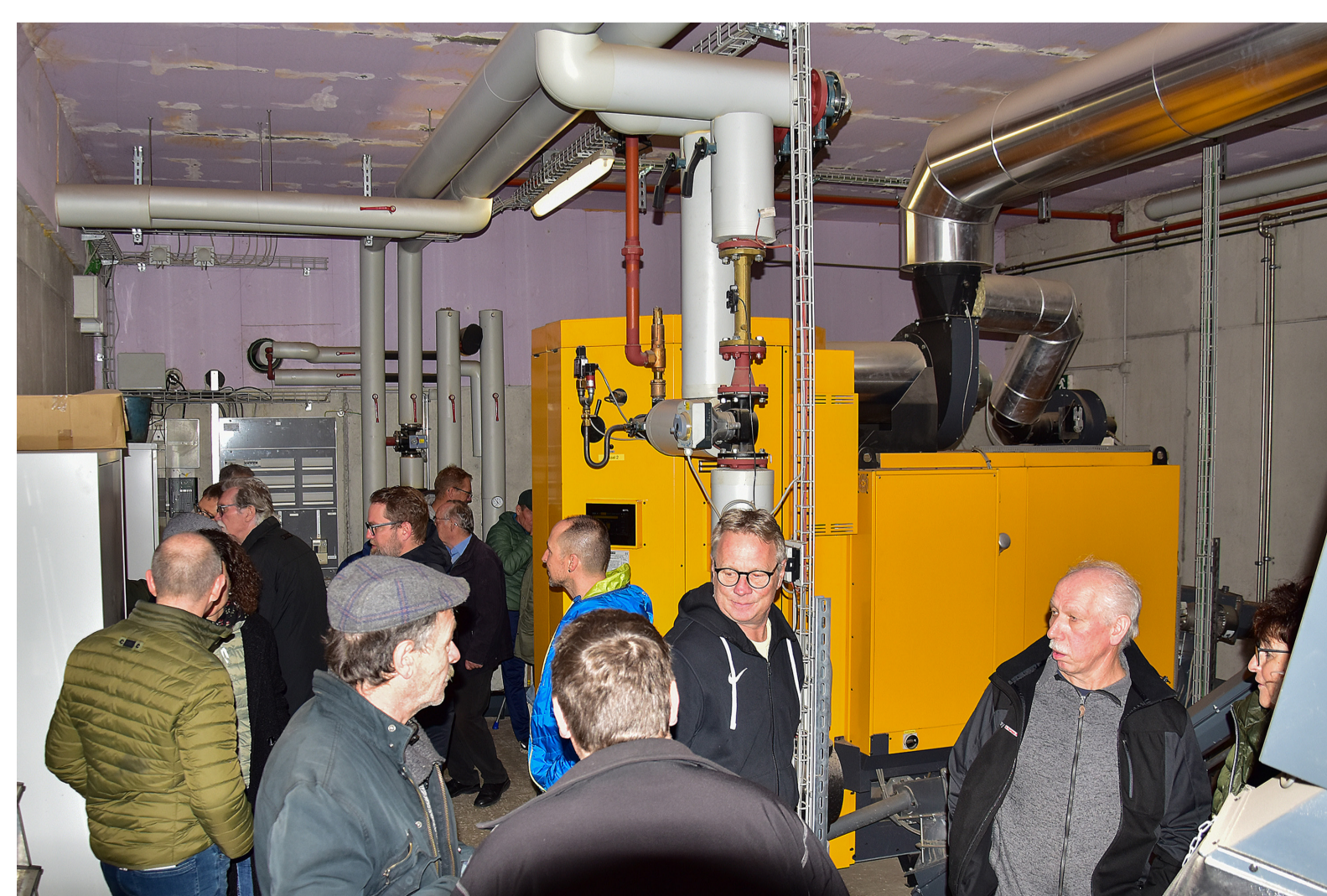
Im Heizkeller stehen zwei Öfen.